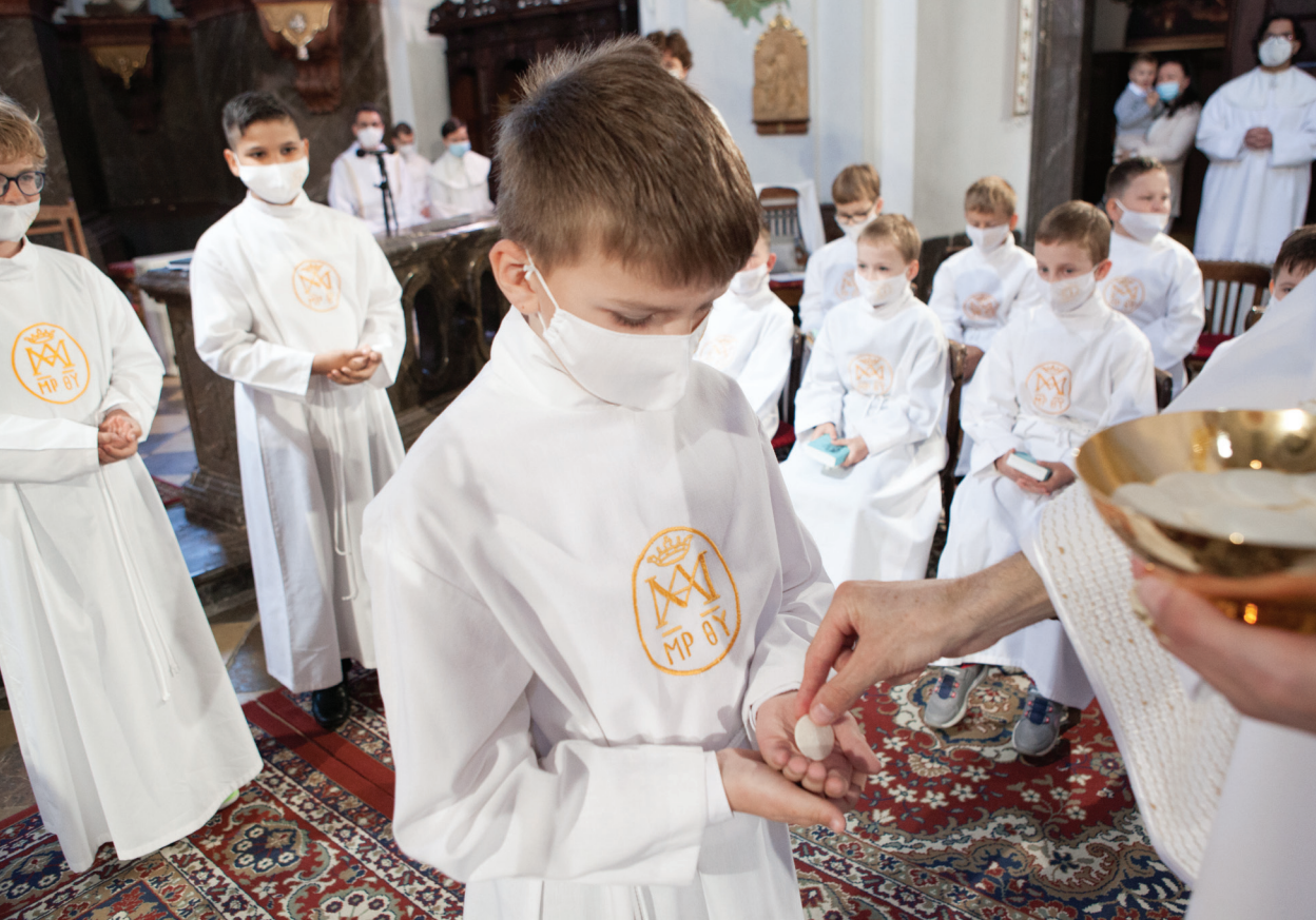
Kostol Najsvätejšej Trojice, prvé sväté prijímanie, 6. júna 2021, 23 detí