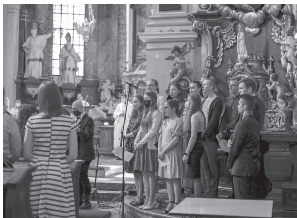
Svätú omšu sprevádzali maturanti svojim spevom.