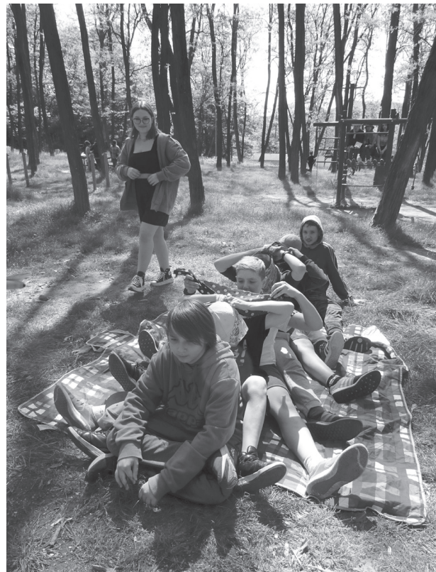
Deviatci na účelovom cvičení pripravili mladším žiakom rôzne zábavné úlohy.

Šiestaci si tiež vyskúšali, ako sa knižná