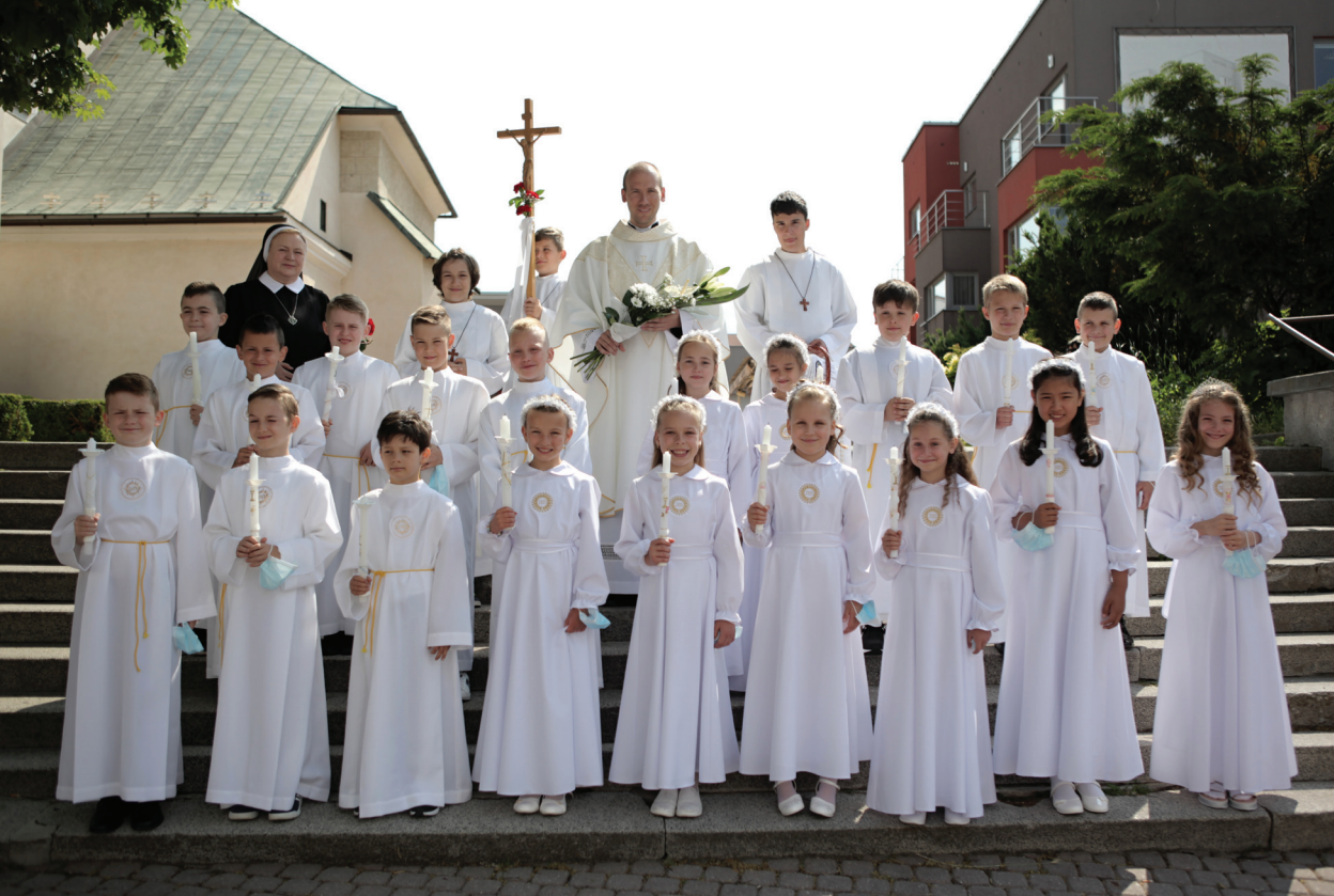
Kostol sv. Bartolomeja, prvé sväté prijímanie, 12. júna 2021 9:00 hod. - 19 detí (ZŠ Mariánska), 11:00 hod. - 32 detí (ZŠ Sama Chalupku)