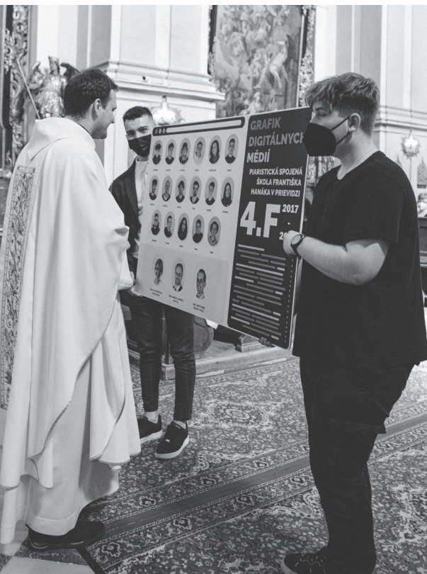
Maturanti zo strednej odbornej školy prinášajú svoje tablo.