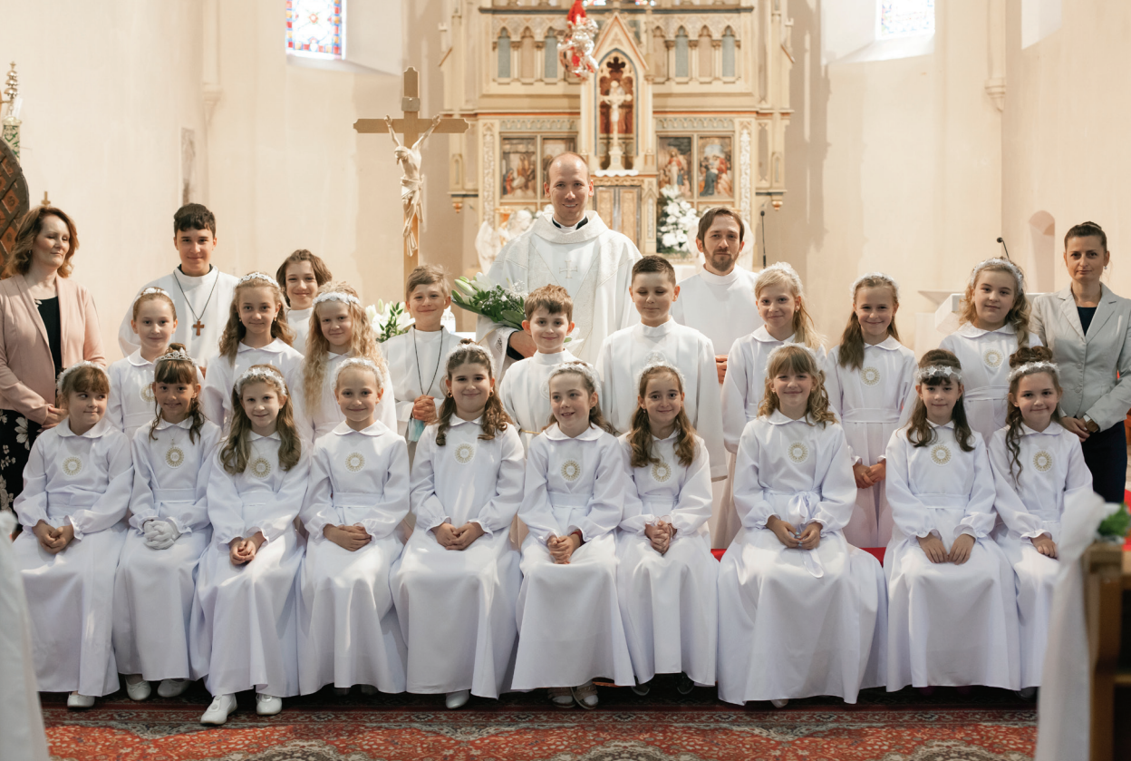
Kostol sv. Bartolomeja, prvé sväté prijímanie, 13. júna 2021 9:00 hod. - 20 detí (ZŠ Rastislavova), 11:00 hod. - 23 detí (ZŠ Energetikov a Malonecpalská)