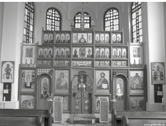
Ikonostas ruského typu v gréckokatolíckej katedrále v Bratislave