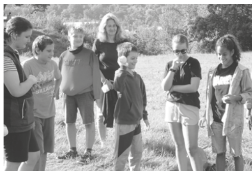
Žiaci 2. stupňa, študenti gymnázia a SOŠ absolvovali účelové cvičenie