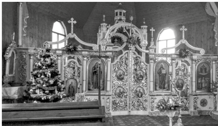
Ikonostas gréckeho typu v obci Kurimka na východe Slovenska