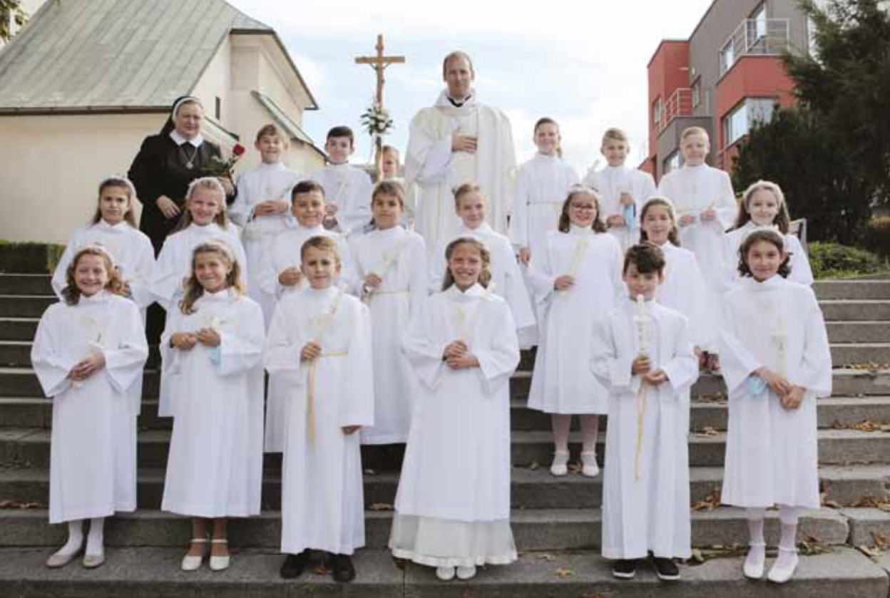
Kostol sv. Bartolomeja, prvé sväté prijímanie, 27. septembra 2020 9.00 hod. - ZŠ Mariánska - 19 detí, 11.00 hod. - ZŠ Sama Chalupku - 28 detí