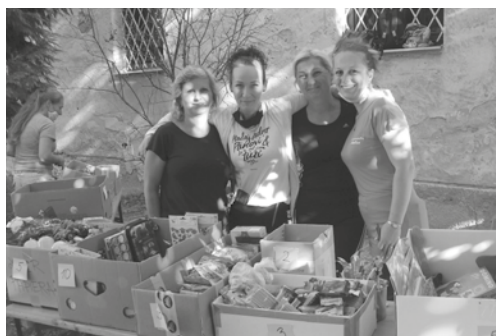
Žabomarket pre žiakov prvého stupňa zorganizovali pani učiteľky a vychovávateľky

Žiaci 2. stupňa, študenti gymnázia a SOŠ v ten istý deň absolvovali účelové cvičenie v rôznych lokalitách (Mariánsky vršok, Golfové ihrisko, Lesopark). Počas neho prešli rôznymi stanovišťami, na ktorých si precvičili a zopakovali svoje zdravotnícke, pohybové, geografické, ale i tvorivé schopnosti. Niektorí z nich (keď chceli) sa na záver svojej práce mohli pomodliť aj takúto modlitbu: