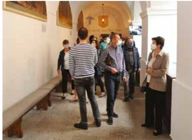
Deň otvorených dverí po rekonštrukcii priestorov u piaristov, 6. septembra 2020