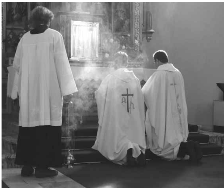
Z obradu slávnostného uvedenia nového pána dekana do služby v našej farnosti