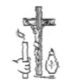
Odpočínajte veční dny oúšiam, Pane...

S kresťanskou nádejou na stretnutie vo večnosti sme sa rozlúčili so zomrelými: