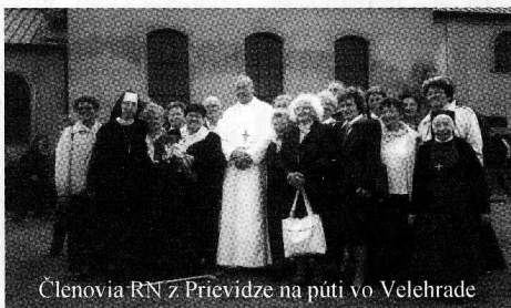
Členovia RN z Prievidze na púti vo Velehrade

nie je príťaž a že ja nie musím žiť ako dobrý kresťan, ale že môžem Krista nasledovať slobodne. Aby sme mohli na konci života so svätým Pavlom povedať: „Viem, komu som uveril ...“