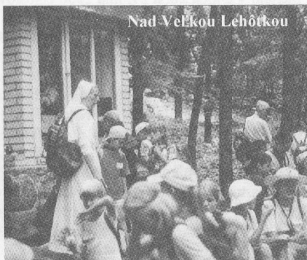
Nad Veľkou Lehôtkou