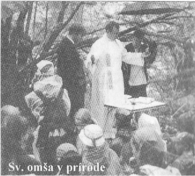
Sv. omša v prírode

2. Ťažko by som si robil nejakú predstavu, keď som ešte takto s deťmi nepracoval, ale bolo to výborné, aj napriek mojim veľkým obavám.