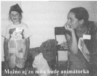
Možno aj zo mňa bude animátorka

3. Takým najväčším uspokojením boli rodičia, ktorí sa väčšinou pýtali, prečo ešte aj ďalší týždeň tábor nepokračuje. Deťom sa veľmi páčilo, pútavé boli pre nich aj svedectvá animátorov, ktorí im boli staršími kamarátmi po celý týždeň. Krásne boli nástupy, pokriky jednotlivých skupín a hlavne to, že sa učili robiť všetko spoločne. Pre mnohých to bola úplne nová skúsenosť.