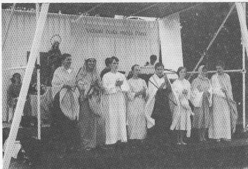
Divadelná skupina AVE na prievidzskej púti v roku 1999 s hrou BARTOLOMEJ