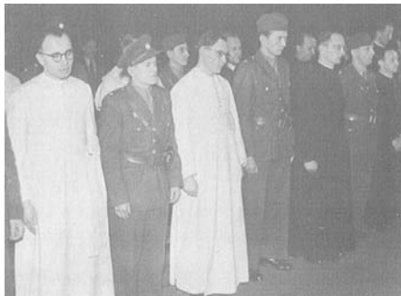
Akcia K predchádzal obrovský vykonštruovaný proces s rehoľníkmi

Činnosť zákrokových jednotiek na miestach kláštorov nebola zameraná len na údernú fázu odsunu rehoľníkov. Oveľa väčší bol jej prevenčný dosah. Hneď po príchode malo dôjsť k obsadeniu telefonnej ústredne, zablokovaní prístupu na zvonice a k siréne, tiež mali byť obsadené poštové úrady. Úlohou vojska bolo obsadiť vchody a východy z obce, do obce sa bolo možné dostať len za pomoci hesla, ktoré ovládali motorizovaní príslušníci (tzv. spojky) a vojsko. Heslo v banskobystrickom regióne znelo „Bodák-Bystrica“.