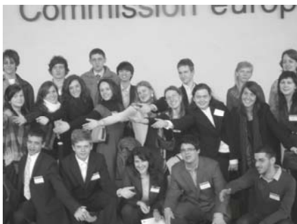
Vítazi z 27 krajín EU

Do Bruselu sme leteli. Najradšej by som bola, keby tam so mnou smeli byť nielen moji najbližší, ale aj celá moja trieda a škola, aby sa tiež mohli tešiť so mnou a spoznať úžasných ľudí, mladých i starších. Ceny nám odovzdávali pani eurokomisárka pre vzdelávanie, kultúru, viacjazyčnosť a mládež Androulla Vassilio-