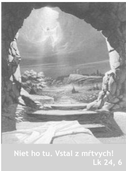
Niet ho tu. Vstal z mŕtvych! Lk 24, 6

Spomeňme si na smutné miesto uprostred rušného Manhattanu, na jamu po mrakodrapoch, zničených teroristickým útokom na prahu tretieho milénia, 11. septembra 2001. Američania nazvali toto miesto - túto nezahojenú ranu na tele nášho sveta - Ground Zero (Point Zero), teda bod nula. Vidiac tento obraz, nemožno sa zbaviť myšlienky: áno, tu a teraz má Amerika (a svet) svoj „bod nula“.