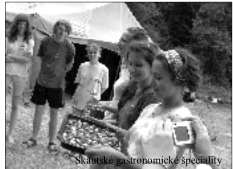
Skautské gastronomické špeciality