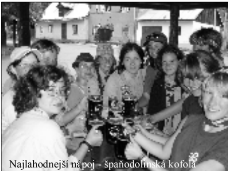
Najlahodnejší nápoj - španodolinská kofola