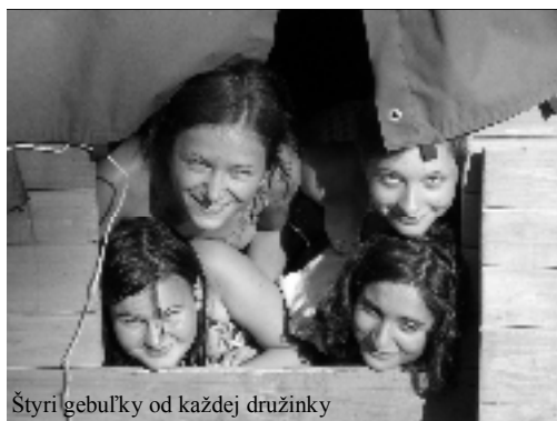
Štyri gebuľky od každej družinky