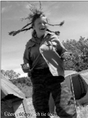
Účesy, účesy, ach tie účesy,