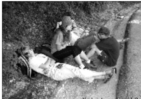
Kedyž na níz vrátiš?