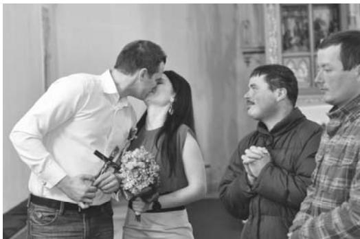
Krátko po sobášii so svadobnými svedkami

My sme doma už od rozpadu Sovietskeho zväzu vnímali umelé prehlbo-