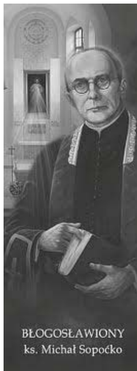
BŁOGOSŁAWIONY ks. Michał Sopoćko

Od roku 1919 pôsobil Michal Sopočko ako vojenský kaplán pre poľskú armádu. O osem rokov neskôr bol vymenovaný za duchovného správcu seminára vo Vilniuse. Z tejto funkcie bol štyroch rokoch uvoľnený. Vrátil sa do Varšavy, kde získal v oblasti pastoraálnej teológie titul docenta.