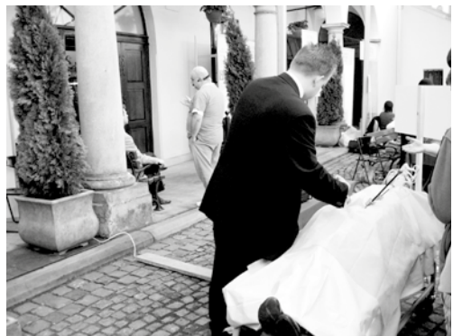
Festival vedy, Krakov 2006