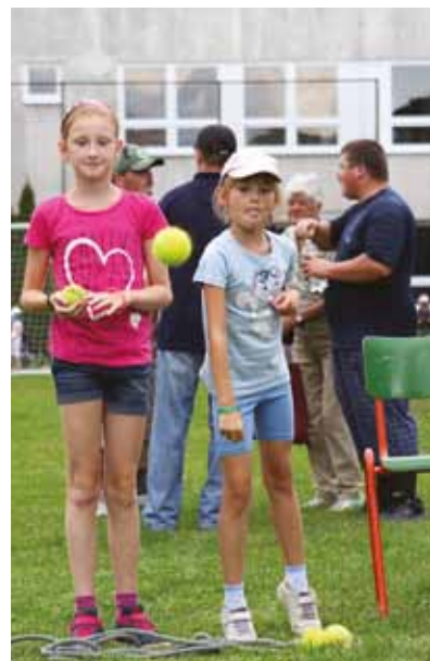
Deň farnosti, športovo-oddychové popoludnie, 14. augusta 2016