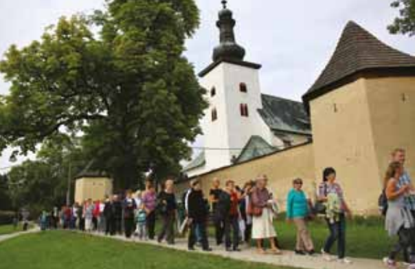
Prievidzská púť k Nanebovzatej Panne Márii 13. - 14. augusta 2016