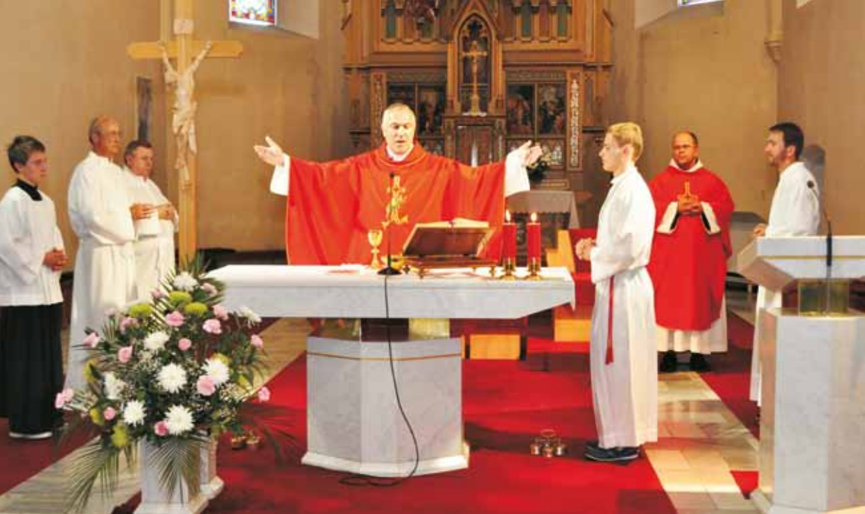
Sviatok svätého Bartolomeja, 24. augusta 2016