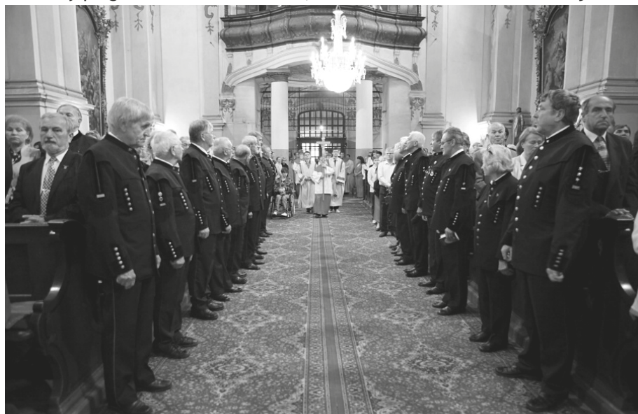
Banícka omša v Kostole Najsvätejšej Trojice v Prievidzi v roku 2014