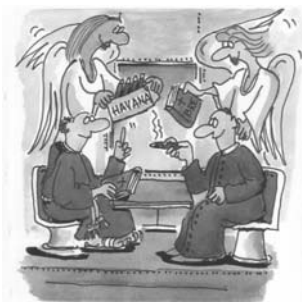
Jezuita a františkán fajčia fajku...

BERNARD PEYROUS - MARIE-ANGE POMPIGNOLIOVÁ