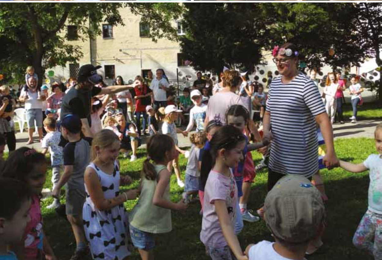
Piaristická základná škola, záhradná slávnosť Piarfest, 3. júna 2016