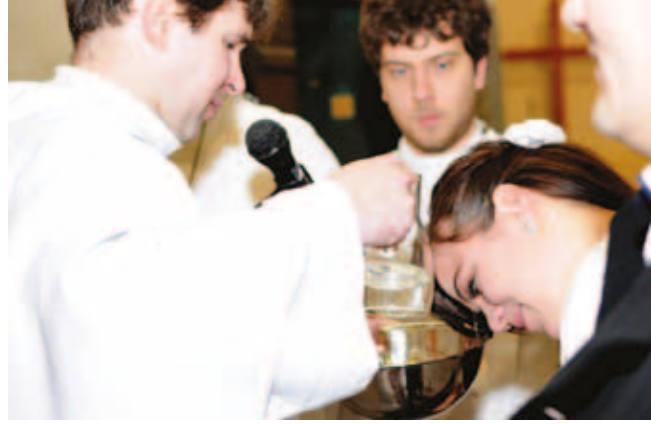
Biela sobota, 26. marec 2016