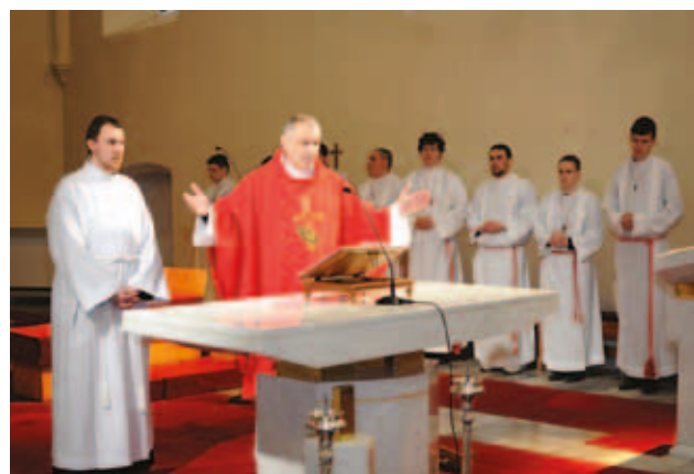
Velký piatok, 25. marec 2016