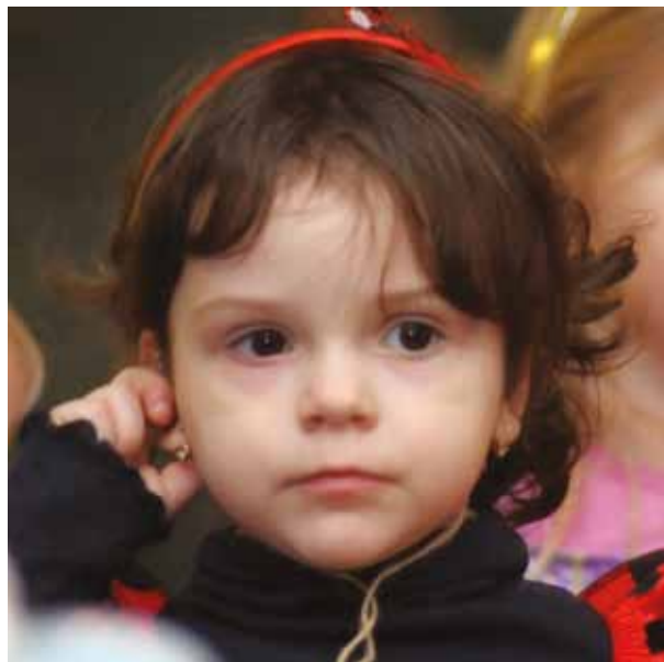
Na maškarnom plese, 5. február 2017, Kultúrny dom v Necpaloch