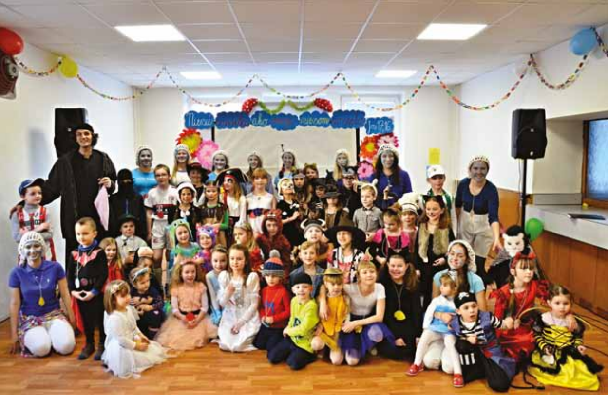
Na maškarnom plese, 12. február 2017, Piaristická škola F. Hanáka