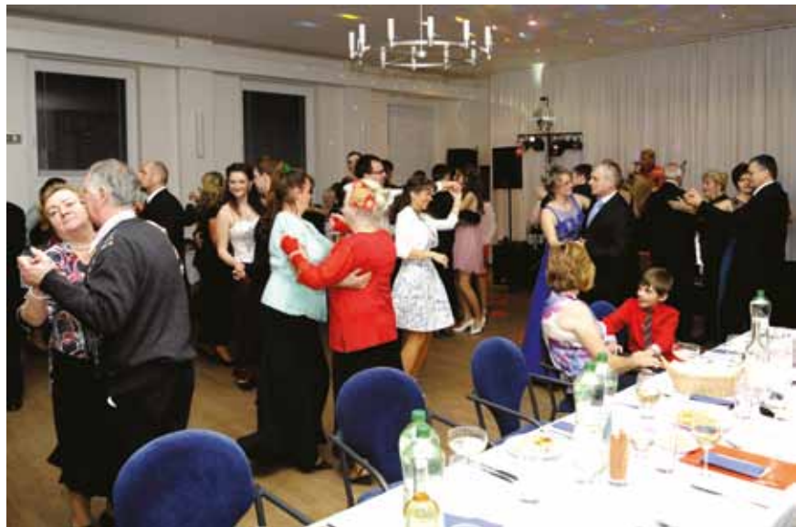
Farský ples, 4. február 2017, Kultúrny dom v Necpaloch