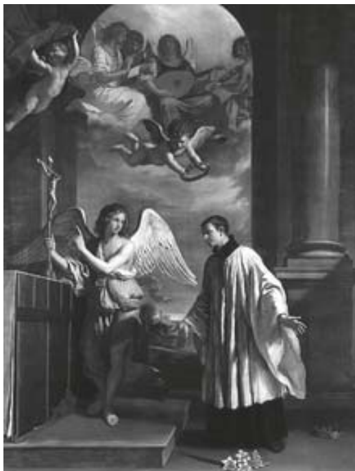
Povolanie svätého Alojza Gonzagu (Giovanni Francesco Barbieri)

Neskôr sa obaja bratia dostali na dvor vojvodu Viliama v Mantove. Do srdca Alojza sa pri pohľade na všetko to bo-