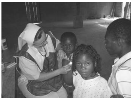
Sestry zo Spoločnosti dcér kresťanskej lásky sv. Vincenta de Paul pri svojej misijnej práci v sirotinci na Haiti.