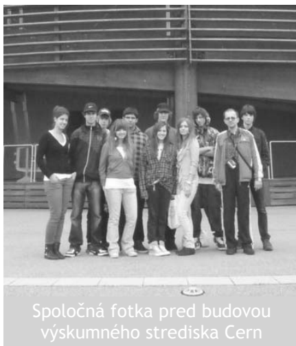
Spoločná fotka pred budovou výskumného strediska Cern