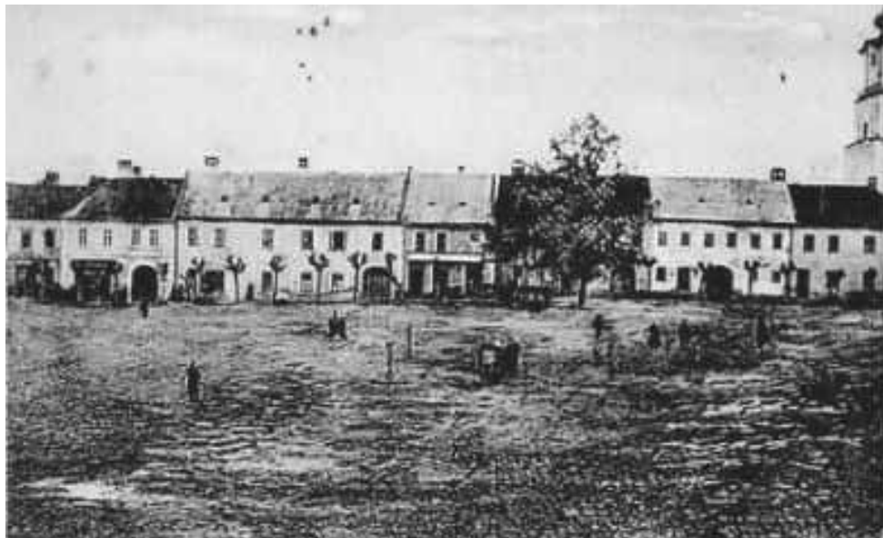
Kláštor Nepoškvrneného Srdca Panny Márie v Prievidzi, r. 1908

Kláštor aj školy boli zatvorené v roku 1950, kedy boli sestry násilne sústredené do Ivánky pri Nitre a po roku do Čiech, kde ťažko pracovali v textilných fabrikách a neskôr v ústavoch sociálnej starostlivosti až do r. 1991.