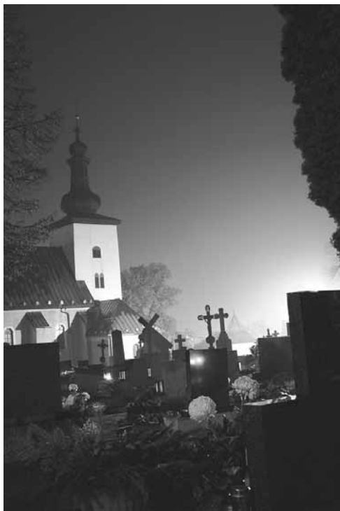
Mariánsky kostol s cintorínom v Prievdzici

Len trpezlivosť! Maj nádej v budúcu slávu! Nepachtí po prítomnom, pominuteľnom šťastí. Nechci patriť medzi tých, čo sa majú dobre tu na zemi. Blahoslavený, kto je šťastný preto, že nie je ešte šťastný. Blahoslavený, kto dúfa, kto má nádej všetko nájsť pri smrti, kde iní v jedinom okamihu strácajú všetko, čo mali... A beda tým, ktorí pre radosť z prítomného šťastia prestali dúfať v budúce a potom sa oň aj usilovať.