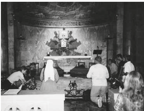
Kostol všetkých národov, Jeruzalem

Vo Svätej Zemi, v jeruzalemskom chráme obopína majestátny oltár veľká trňová koruna. Jeden z nástrojov Ježišovho mučenia a utrpenia na križovej ceste. Temer každý pútnik, ktorý príde do Svätej Zeme si aj tu, pri trňovej korune, nájde svoje tiché miestečko na rozjímanie.