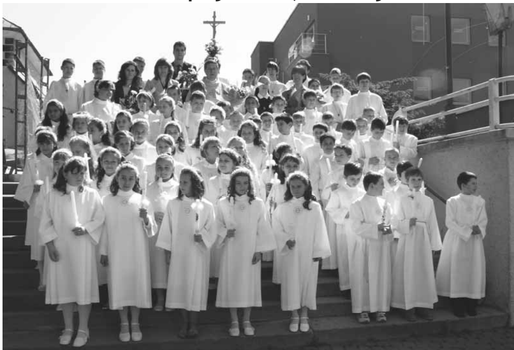
ZŠ Rastislavova, I. a III. ZŠ S. Chalupku - spolu 59 detí