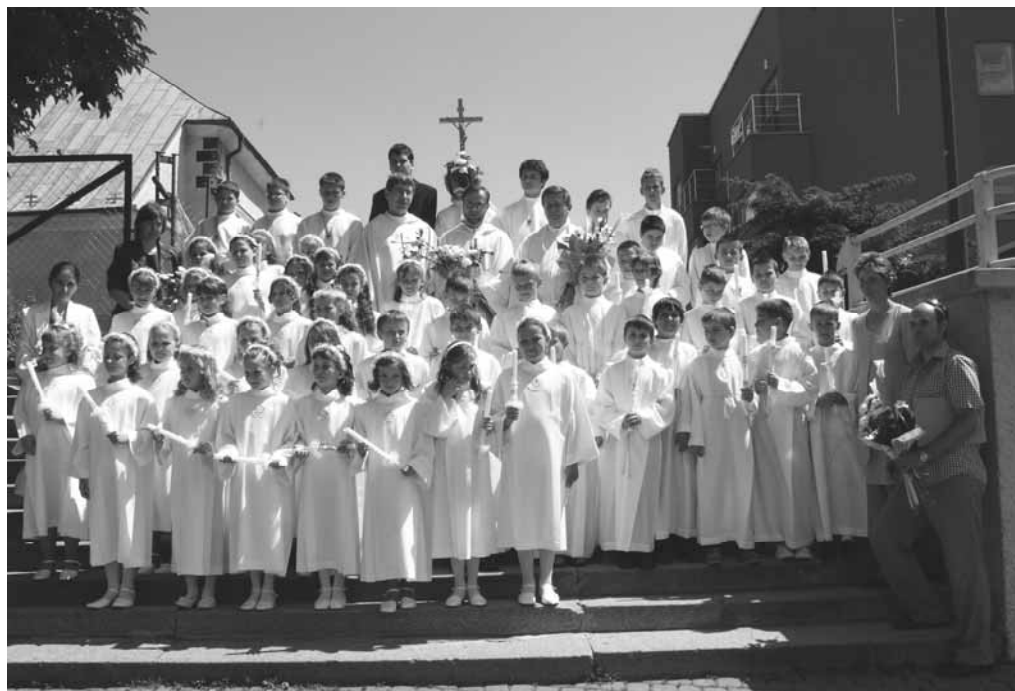
ZŠ Energetikov, ZŠ Mariánska a ZŠ Malonecpalská - spolu 42 detí