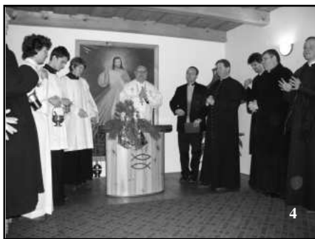
Foto: 4.- požehnanie Centra pre rodinu 5.-jasličková pobožnosť