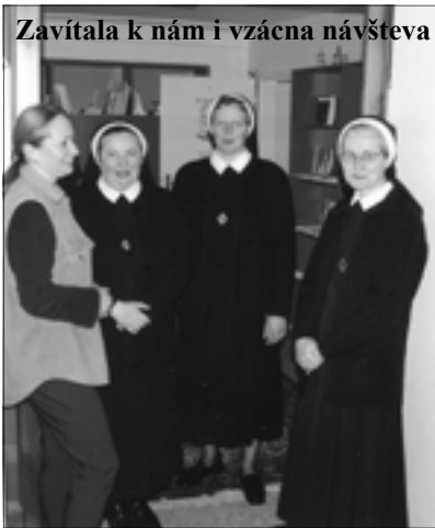
Zavítala k nám i vzácna návšteva