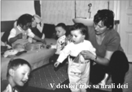
V detskej izbe sa hrali deti