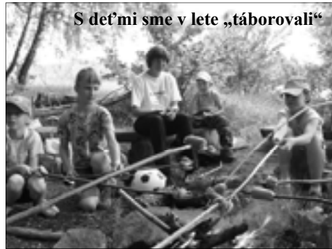
S deťmi sme v lete „táborovali“