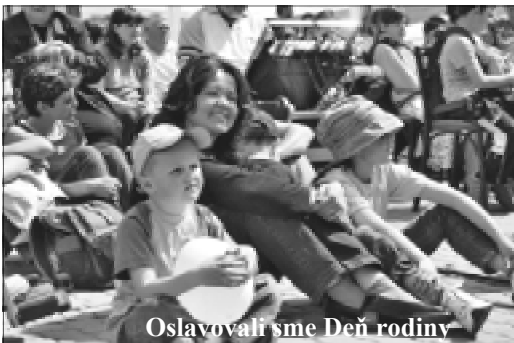
Oslavovali sme Deň rodiny