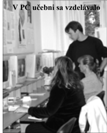
V PC učebni sa vzdelávalo