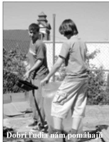
Dobří ľudia nám pomáhajú