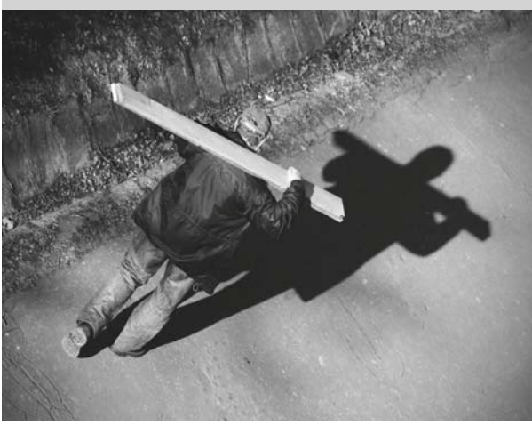
Z textu piesne

V liturgickom roku sa striedajú obdobia očakávania, prípravy, radosti, zábavy a veselosti. Nie je to pre nás samých pozhnaním? Boh od nás nežiada neustále nasadenie. On je ten, ktorý nám skutočne neustále ponúka tú vzácnu devízu - „čas“.