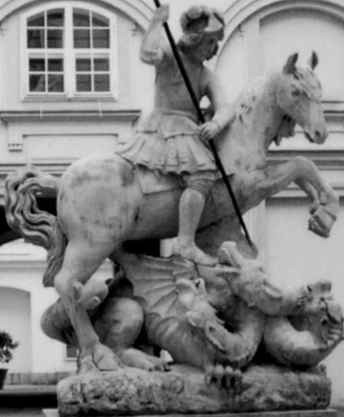
Socha sv. Juraja

Aj pre teba som tu - Rozhovor s M. Hrivňákom KPM - Biblická nedeľa - Bibliáda - Skautský rok