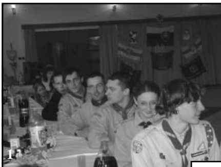
Sv. Juraj - patrón skautov na celom svete