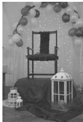
Ples študentov a priateľov Piaristickej spojenej školy 31. január 2013, Súkromná školská jedáleň, Prievidza