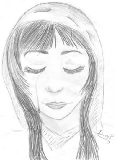
Kresba: Lucia Pappová, 7.A